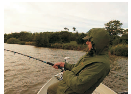
Le pêche du silure aux vers est très intéressante dès le mois de mars

Sur la prairie du centre PEP, respectez l'activité du centre nautique (école de voile à proximité les après-midi en période estivale).