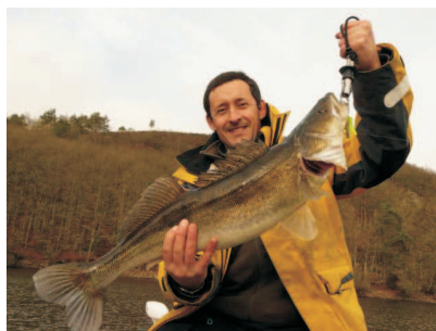
Le parcours présente une très bonne densité de sandres