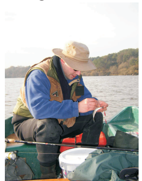
Leurres et mort-manié pour le sandre

Pêche en float-tube, kayak et bateau autorisée. Pour la pêche en bateau avec moteur supérieur à 6 cvs, il faut soit le permis mer, soit le permis fluvial (sur le secteur d'Arzal à Redon).