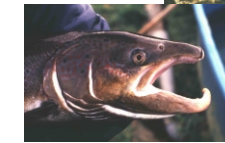
Le mâle en période de reproduction