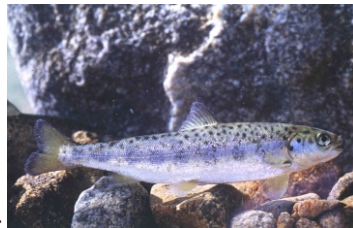
Le smolt ou saumoneau

L'alevin est maintenant sorti de la frayère où il est né quelques mois plus tôt. Il est alors capable de se nourrir seul (insectes, invertébrés...) Et va devoir trouver un territoire