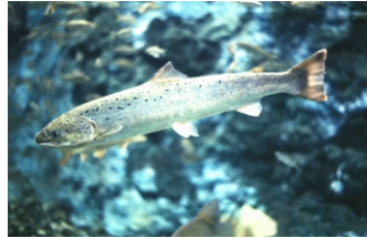
Le saumon en mer

Les smolts parcourent plusieurs milliers de kilomètres pour trouver un secteur où la nourriture est abondante. Certains vont aller jusqu'aux îles Féroés et les autres jusqu'au Groënland (côte sud ouest). Ils vont alors avoir une croissance très rapide