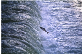
Saumon essayant de franchir un obstacle

Dès mars, c'est le retour dans leur rivière natale des saumons de printemps, après avoir passé deux hivers en mer. De juin à septembre, c'est le retour des "castillons" qui ont passé un seul hiver en mer.