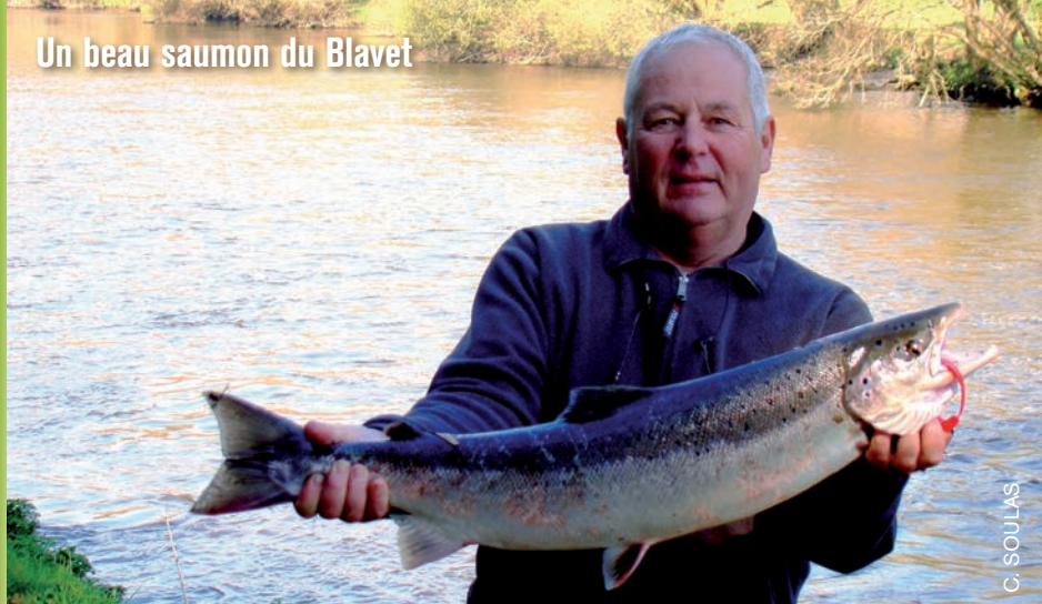
Un beau saumon du Blavet