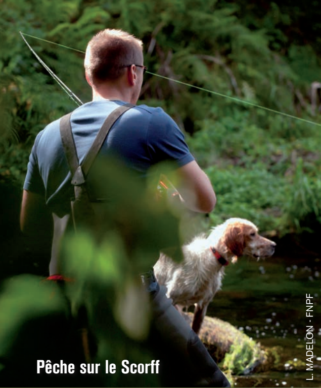
Pêche sur le Scorff