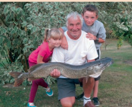
un brochet familial !

Ils ont été invités à l'assemblée générale de leur AAPPMA pour y recevoir une carte de pêche 2014 où un lot. Merci aux détaillants d'articles de pêche pour leur participation à cette dotation.