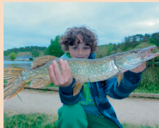
la passion n'attend parfois pas longtemps pour naître.